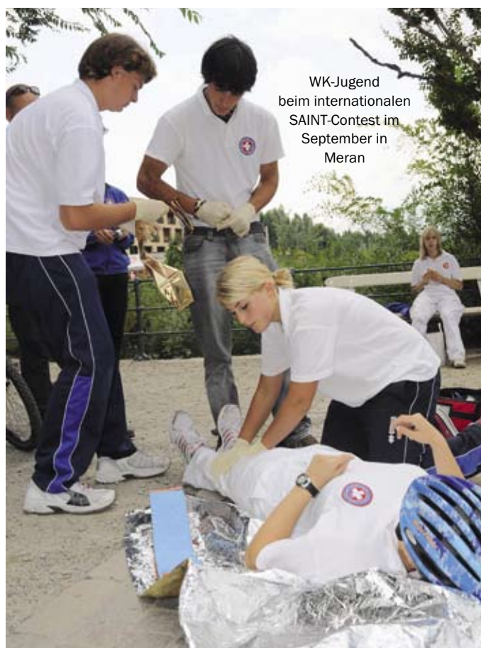
WK-Jugend beim internationalen SAINT-Contest im September in Meran

Weitere Infos: http://www.wk-cb.bz.it/de/ichbrauche/wk_jugend/