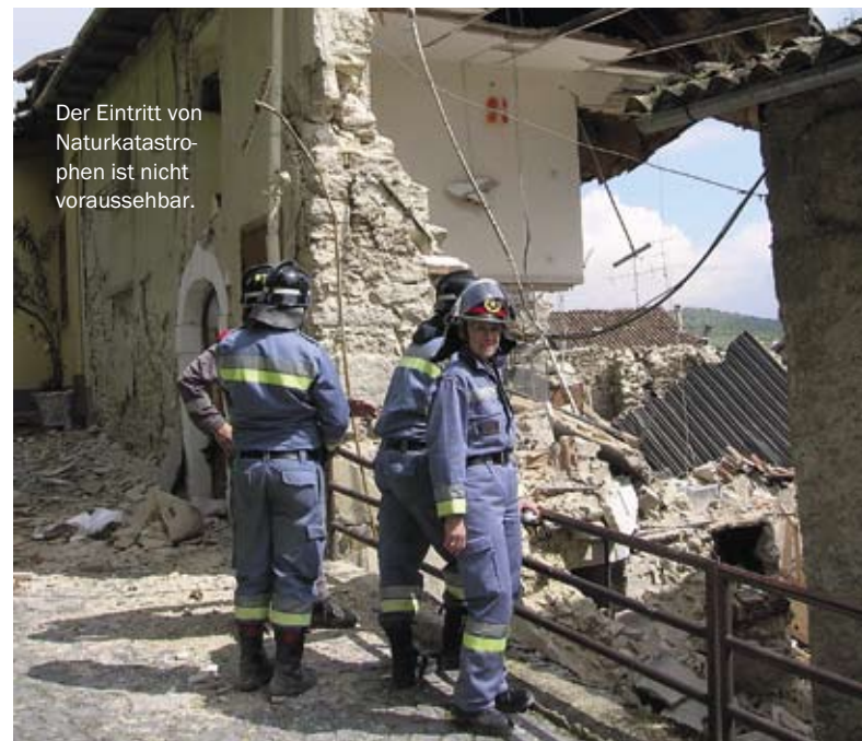
Der Eintritt von Naturkatastrophen ist nicht voraussehbar.

Die Verteilung aller Tageseinsätze der Mitarbeitenden in Sant'Elia sah so aus: 65 Prozent der Arbeit wurde von Weiß-Kreuz-Freiwilligen geleistet, ein Viertel von so genannten externen Freiwilligen , die restlichen 10 % versahen die Köche, die einzigen Angestellten. Bis zum 11. Oktober 2009 kamen 199 Einsatztage zustande; es wurden fast 600 warme Mahlzeiten bereitgestellt. Geht man von einer durchschnittlichen Tagesbelastung von 12 Stunden aus, so wurden rund 15.500 Arbeitsstunden geleistet, fast zur Gänze war es Freiwilligenarbeit. Auf diese beeindruckende Südtiroler Leistungsbereitschaft können wir stolz sein. Vor Wintereinbruch konnten zuletzt fast alle Lagerinsassen in neue Häuser oder provisorische Unterkünfte untergebracht werden. Einige wenige Zelte werden