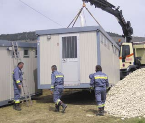
Das Südtiroler Camp wurde von Feuerwehr, Betreuungszug und Bergrettung errichtet.